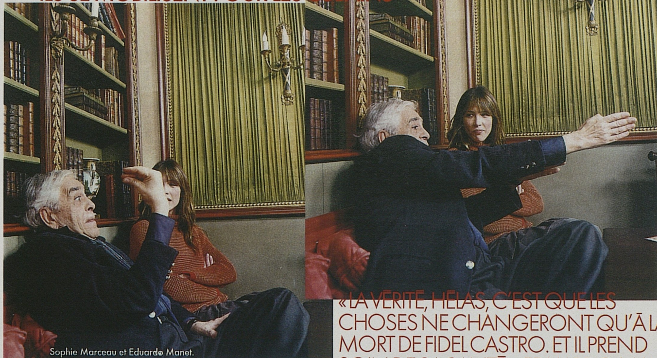
Sophie Marceau et Eduardo Manet.

« LA VÉRITÉ, HELAS, C'EST QUE LES CHOSSES NE CHANGERONT QU'À LA MORT DE FIDEL CASTRO. ET IL PREND SOIN DE SA SANTÉ. » EDUARDO MANET