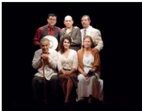
SOBRE LA COMPAÑÍA