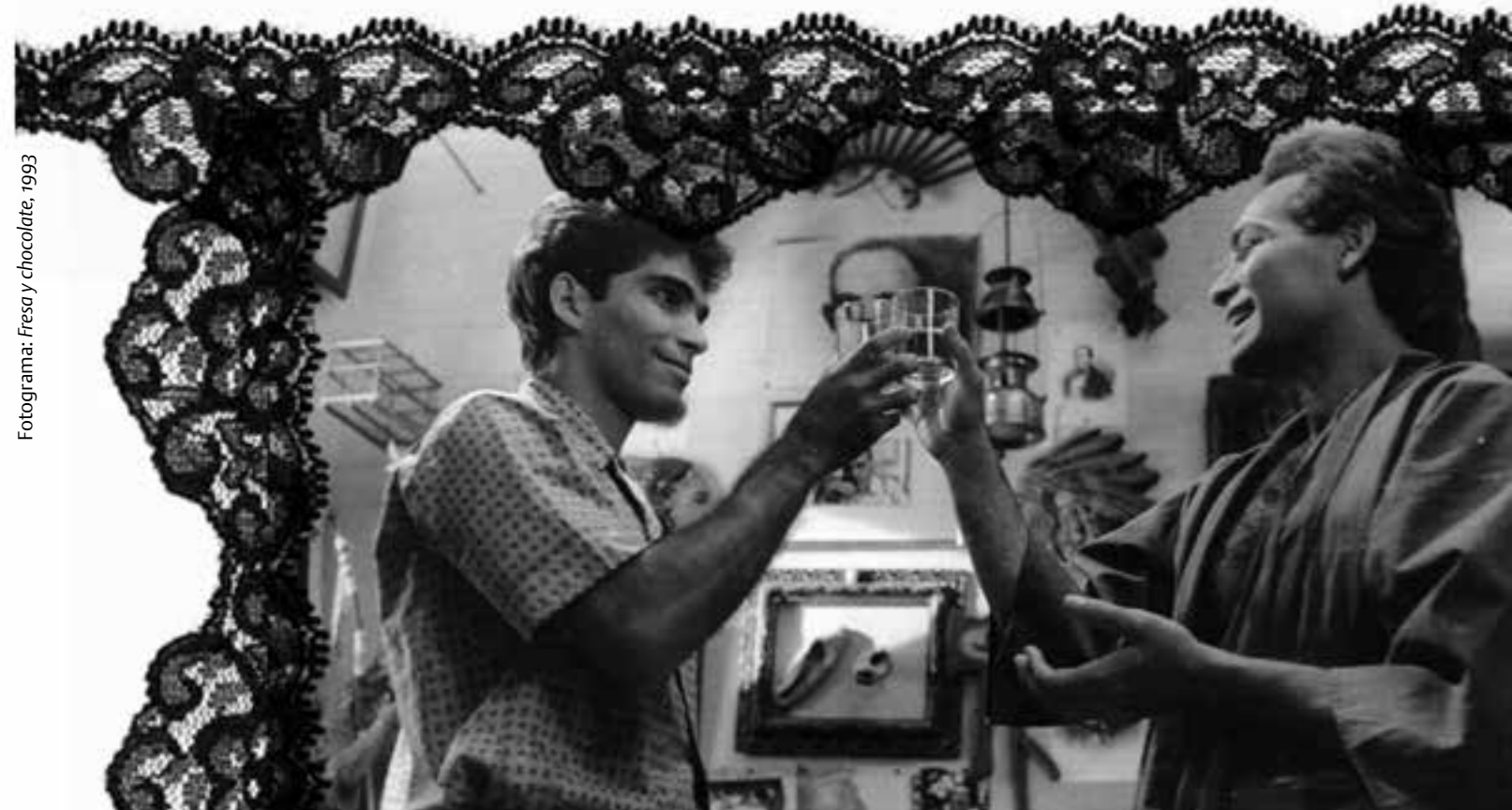
Fotograma: Fresa y chocolate , 1993