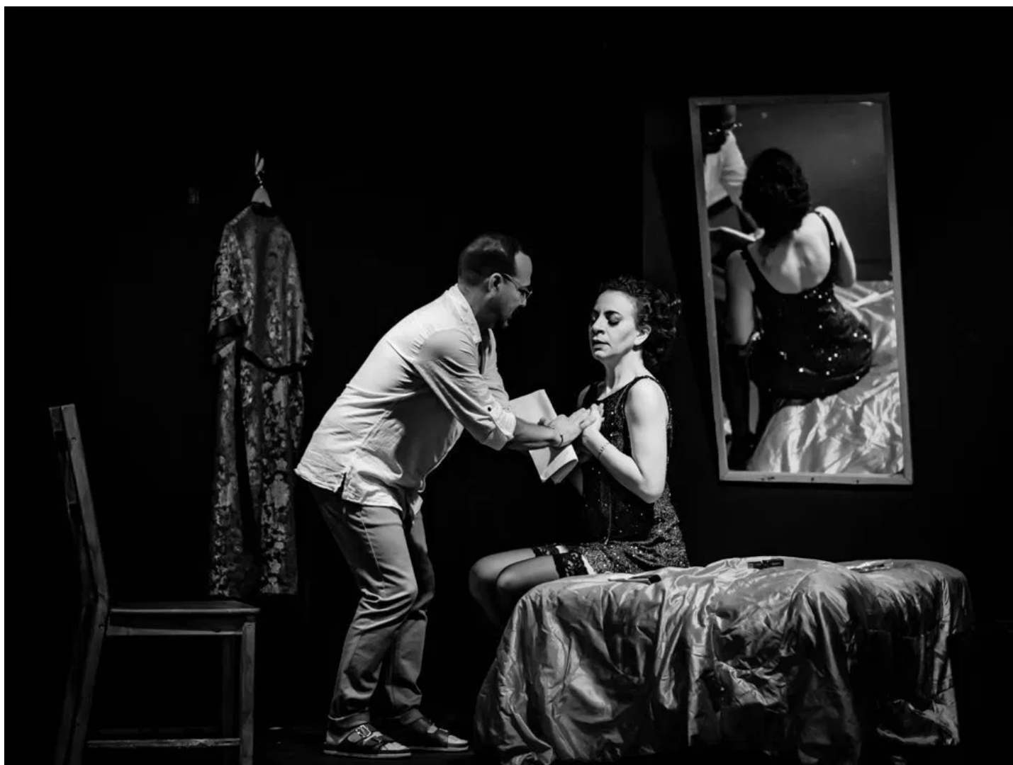
Ensayos de "Maneras de usar el corazón por fuera".

por Maité Hernández-Lorenzo — agosto 6, 2019 en Teatro 0