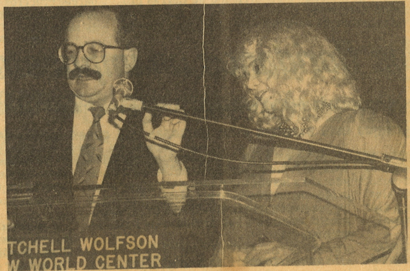
Placa de honor