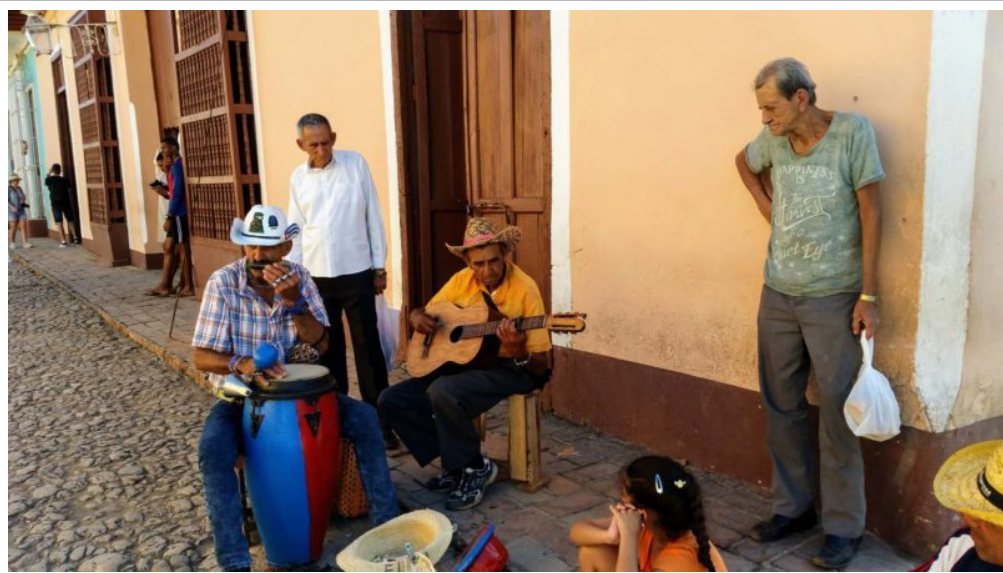
Escena callejera, La Habana, Cuba. Por Chuck Fisher. Cámara: Samsung Galaxy Note 4