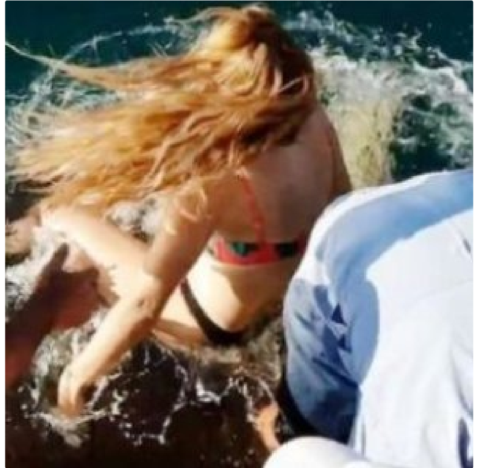
Shark Drags Woman Into Croc-Infested Waters in Wild Video