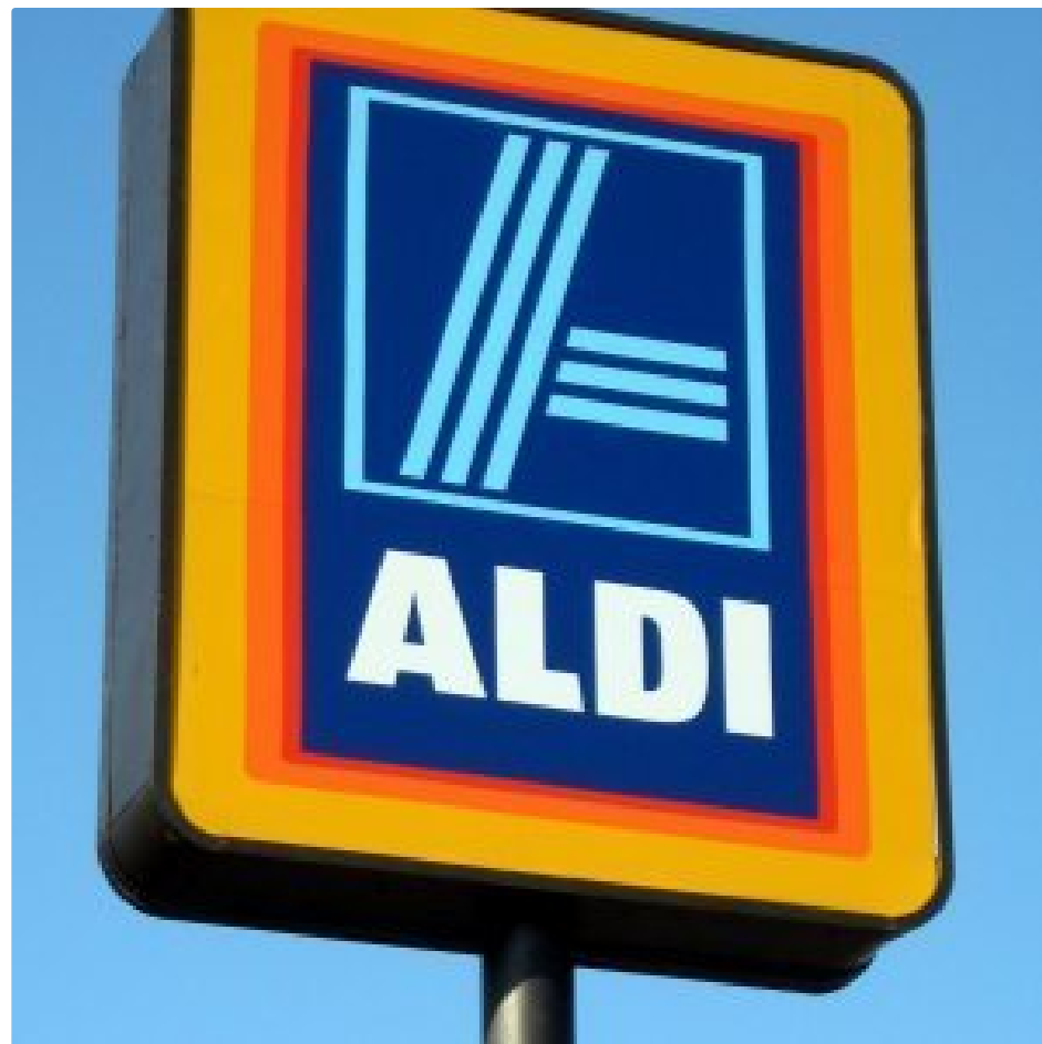
The Untold Truth of Aldi