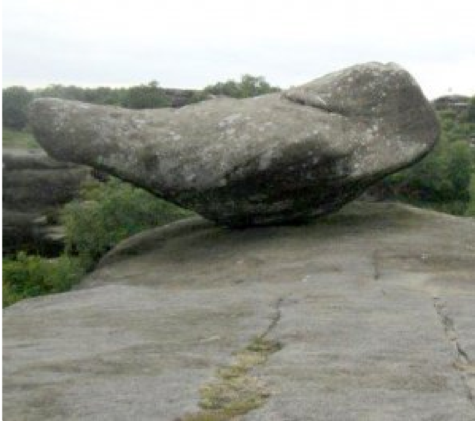
Horrible Kids Destroy 320 Million Years of History in an Instant