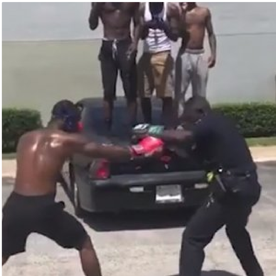
Cop Has Impromptu Boxing Match With Teen After Noise Complaint