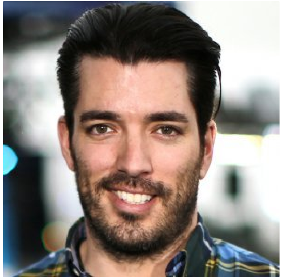
Why 'Property Brothers' is a Total Sham