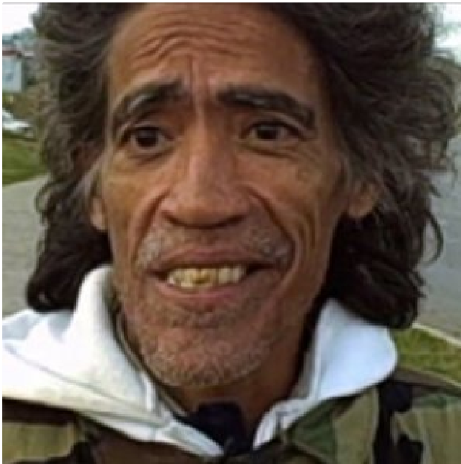
What Happened to 'The Man With the Golden Voice'?