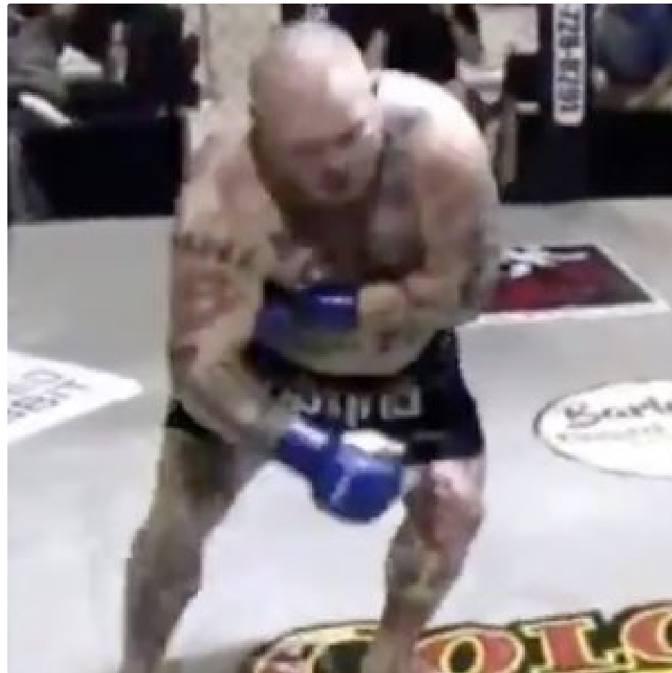
MMA Fighter Fakes Heart Attack in Ring, Then It Gets Weirder