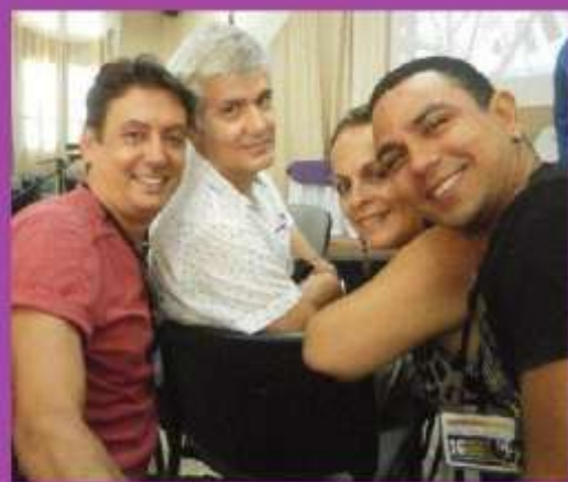
Con Blanca Felipe y el Premio Nacional de Teatro: Carlos Celdrán