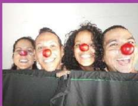
Ensayando los payasos