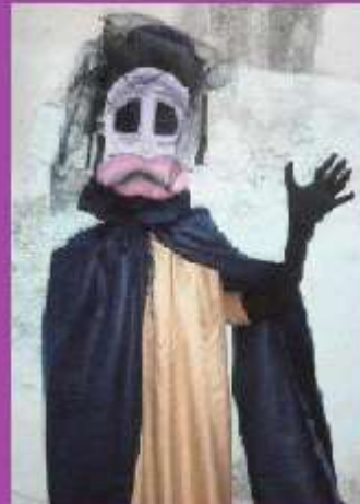
Proximamente en la III Bacanal...