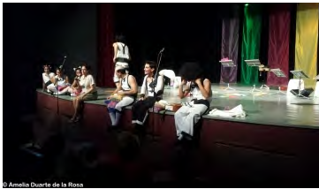
© Amelia Duarte de la Rosa