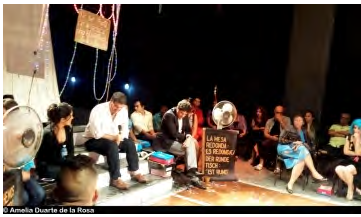
© Amelia Duarte de la Rosa